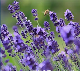
6月の花 ラベンダー

小田原青色申告会 会費引き落としについて 7月16日(火) は 会費の 引き落とし日です。 預金残高のご確認をお願い致します。