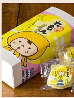
和菓子うめその「れもんまる」