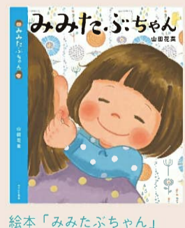
絵本「みみたぶちゃん」