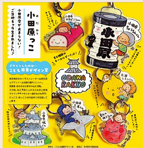
アクリルキーホルダー「小田原っこ」ガチャガチャ